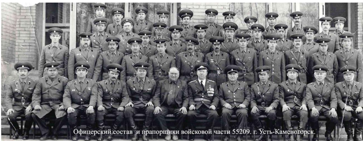
Офицерский состав и прапорщики войсковой части 55209. г. Усть-Каменогорск.